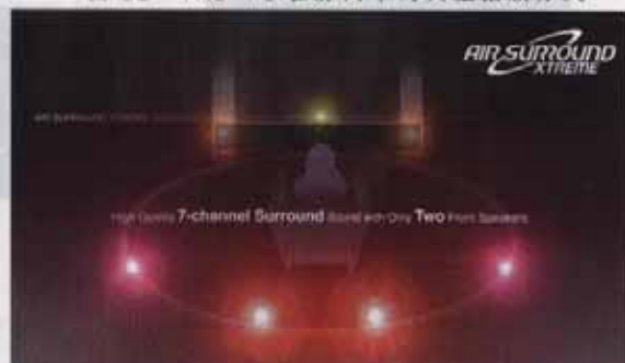
图13 雅马哈的AIR SURROUND XTREME技术