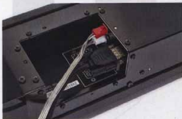
图3 YAS-71CU 背面的接口