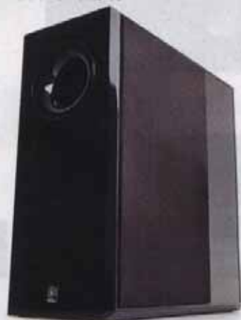
图7 YAS-71SPX 特写