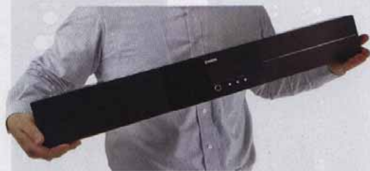
图4 YAS-71CU 小巧精致