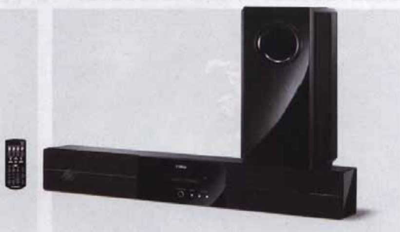
图1 全套 YAS-71