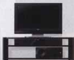
图12 YAS-71在电视柜的两种摆放方式