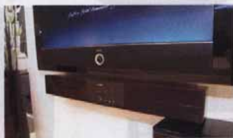
图6 YAS-71CU 挂墙使用