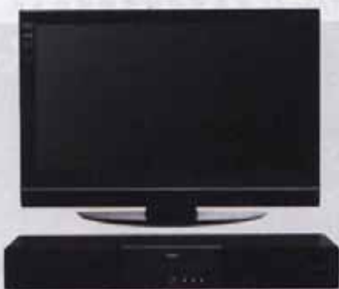
图5 YAS-71 和 32 英寸液晶电视配套使用