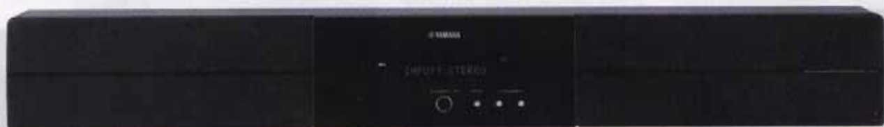
图2 YAS-71CU 正面