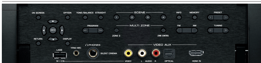
● 前面板上隐藏的的各种功能键

●7声道功率放大器, 每声道110W ●4k/1080p高解析影像升频 ●Cinema DSP 3D环绕音效 (17种DSP音场) ●新增AirPlay网络功能 ●USB插槽支持iPod、iPhone和iPad播放/充电 ●HDMI端子具备ARC和3D功能 ●HDMI ZoneB可让两个房间同步欣赏节目 ●下载AV Controller, 可将智能手机/平板电脑当成放大器的遥控器 ●YPAO R.S.C (反射声音控制) 实现声音优化、多点和扬声器角度测量 ●ECO节能模式减少20%耗电量 ●对白调整加强中置扬声器的声音表现 ●支持多区控制和派对模式 ●LED背光遥控器具备学习功能