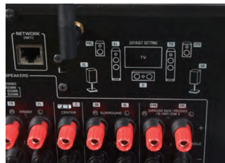
新手玩家有福了,背部面板上直接给出了音频接口与音箱的连接图示